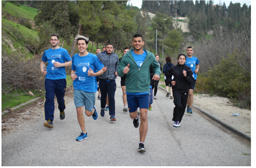
تركض بلا حدود