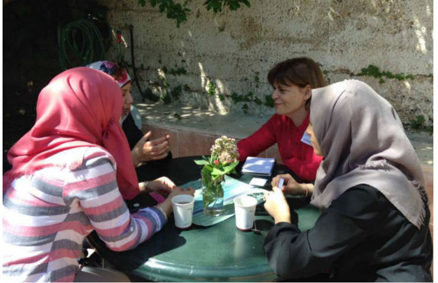
الجيرة الجيدة - "شخينوت توفاه"

يمثل الحي المقدسي أبو نور (الثوري) حيا فريدا من نوعه بسبب الاختلاط بين الأهالي اليهود والمسلمين. وقرر عدة ناشطين من الحي تأسيس مبادرة محلية للتقريب بين المجتمعين ويشمل المشروع دورات اللغة العبرية والعربية والألعاب المشتركة للأطفال والحوار في الحدائق العامة.