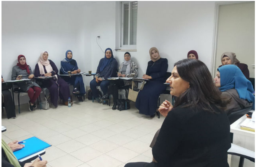
مركز الحوار بين الثقافات

تأسس مركز الحوار بين الثقافات عام 1999 من أجل تعزيز دور مواطني المدينة المقدسة في الحياة الاجتماعية والسياسية والتربوية. ويقع المركز على جبل صهيون بجانب إحدى بوابات المدينة المقدسة، في موقع رمزي "خط التماس" بين الثقافات المتعددة التي تكون حصيلتها مدينة أورشليم القدس - للتأكيد على عدم الإنحياز إلى أي جانب والإنتفاع على الجميع. ويوفر المركز سندا للمواطنين ومبادراتهم المحلية، إضافة إلى تعزيز قدراتهم بمجالات مختلفة مثل تعليم اللغات والإسعاف الأولي والخ.